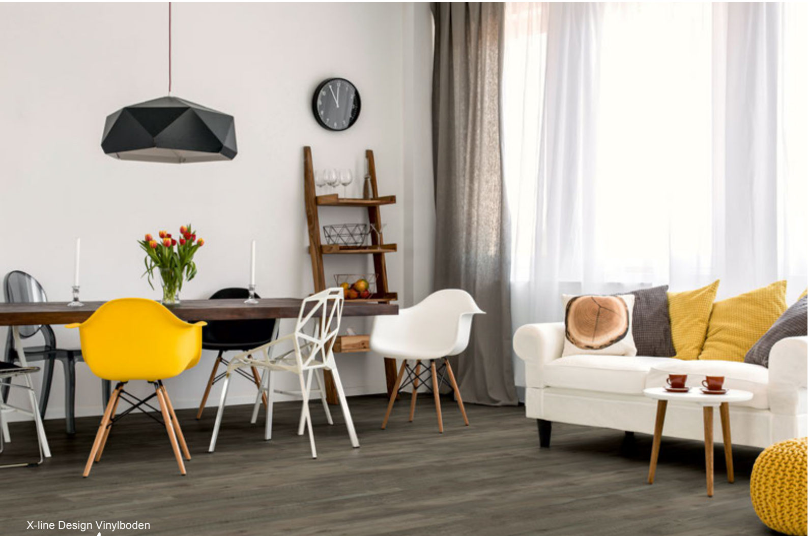
X-line Design Vinylboden Oslo