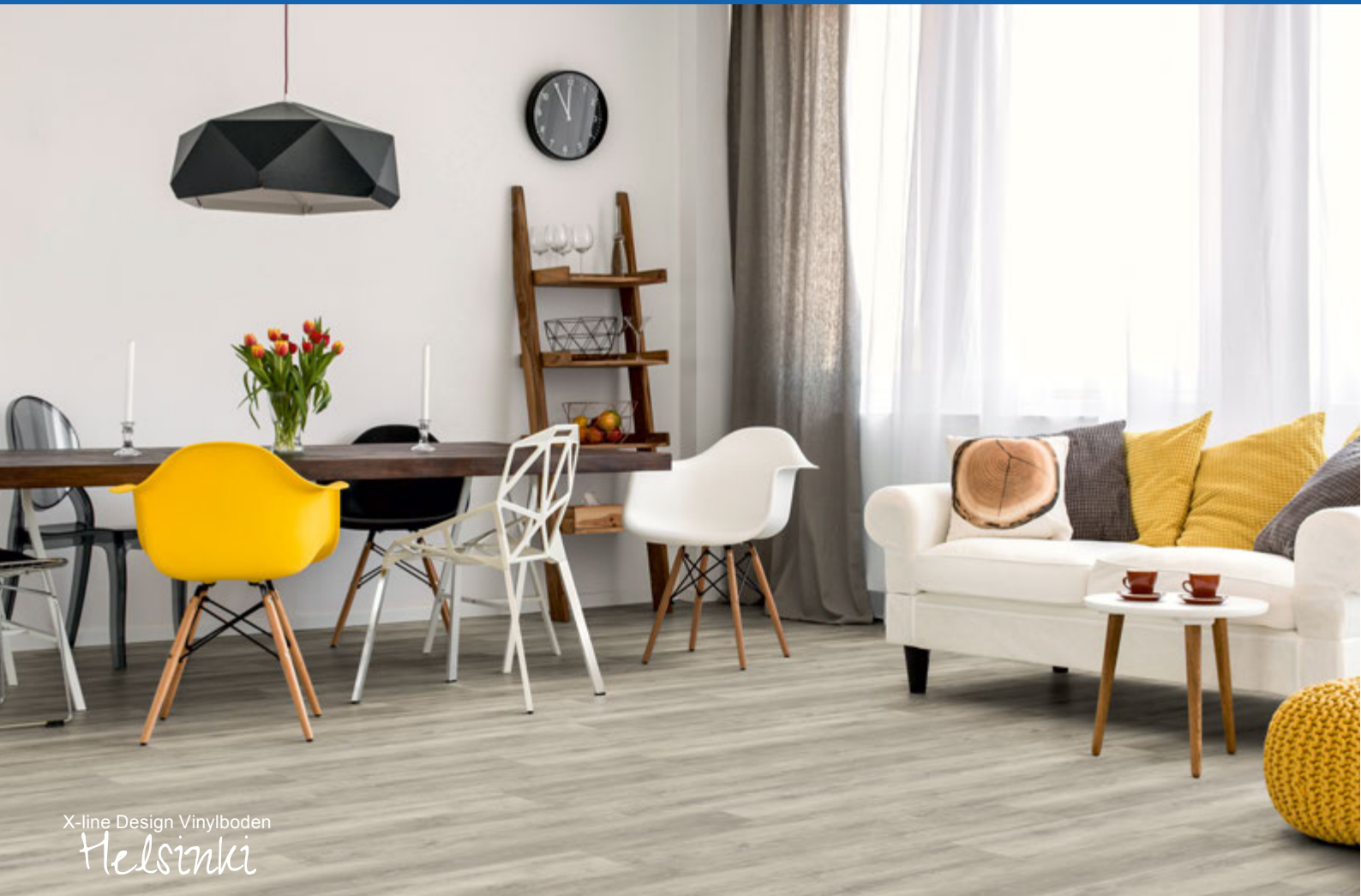
X-line Design Vinylboden Helsinki